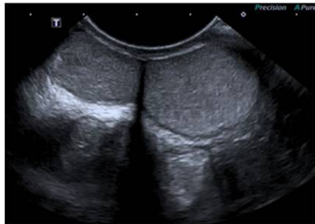
Figura 1 Ecografía escrotal izquierda: demuestra 2 estructuras ecográficamente similares, compatibles con 2 testículos.

Finalmente se realizó exploración quirúrgica por vía inguinal que demostró 2 testículos a nivel escrotal izquierdo (fig. 2). Se decidió la exéresis del teste supernumerario, ante la ausencia de potencial reproductivo, y la posibilidad de degeneración maligna. La anatomía patológica mostró una estructura testicular conservada.