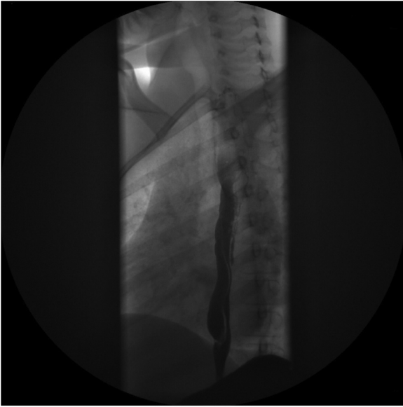
Figura 2 Tránsito realizado tras tratamiento intensivo de la esofagitis eosinofílica con corticoide intravenoso. Se observa paso filiforme de contraste por una doble luz esofágica que impresionan confluir en región distal y finalmente en estómago.

entidad rara que puede producir disfagia, aunque en ocasiones los pacientes pueden estar asintomáticos. El tratamiento debe ser dirigido a la esofagitis si existe reflujo patológico. Cuando hay estenosis, el tratamiento de elección es la dilatación endoscópica.