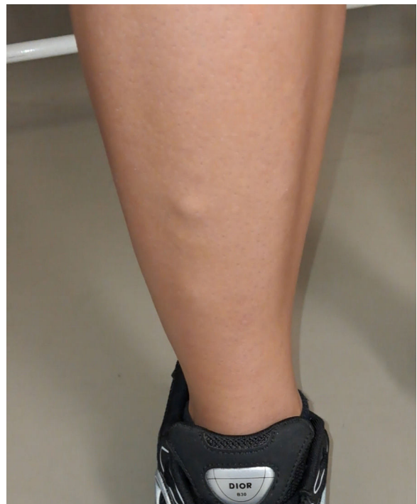
Figura 1 Musculatura en reposo.

Las hernias musculares son una entidad rara en la práctica clínica, y suelen estar infradiagnosticadas o confundidas con otras afecciones de partes blandas. La mayoría de los casos son adultos jóvenes varones, y suelen localizarse en las extremidades inferiores, particularmente en el músculo tibial anterior 1-3 . El tratamiento es conservador con reposo. En los casos más limitantes por el dolor se puede plantear el tratamiento quirúrgico 1,2 .