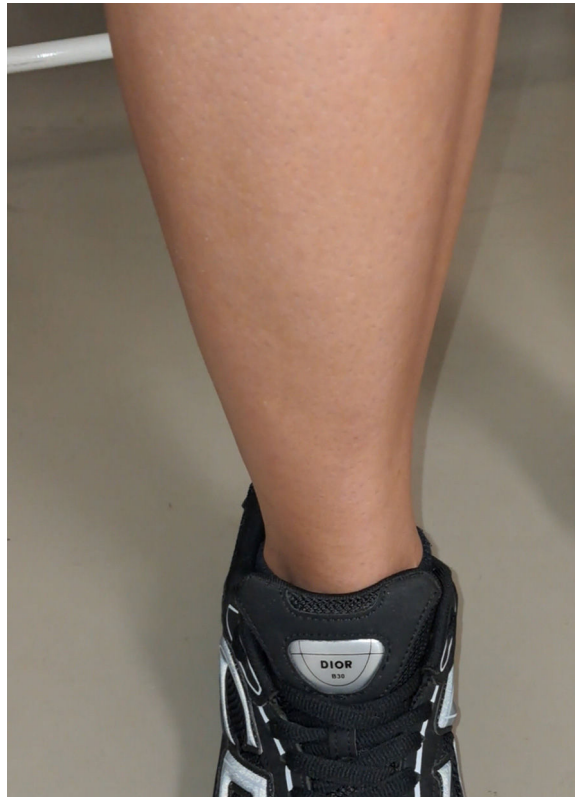
Figura 2 Musculatura contraída.