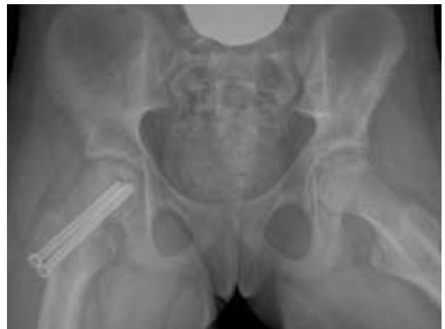
Figura 3 Epifisiolisis grado III intervenida. Fijación con tornillos canulados.