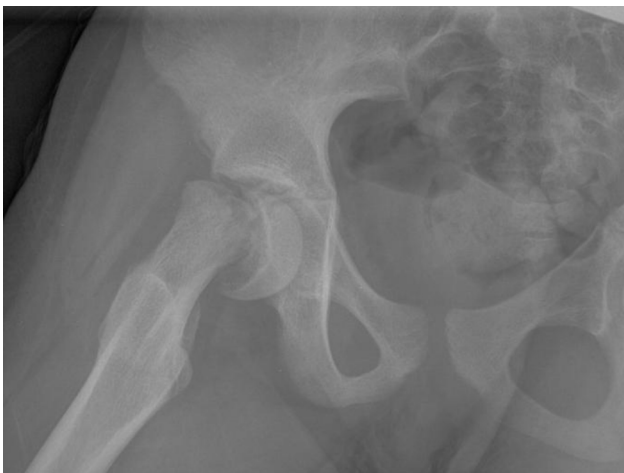
Figura 2 Epifisiolisis grado III de cadera derecha.