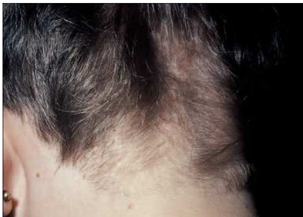
Figura 1. Región occipital en la que se aprecia una hipotricosis difusa con pelos cortos y presencia de hiperqueratosis folicular.