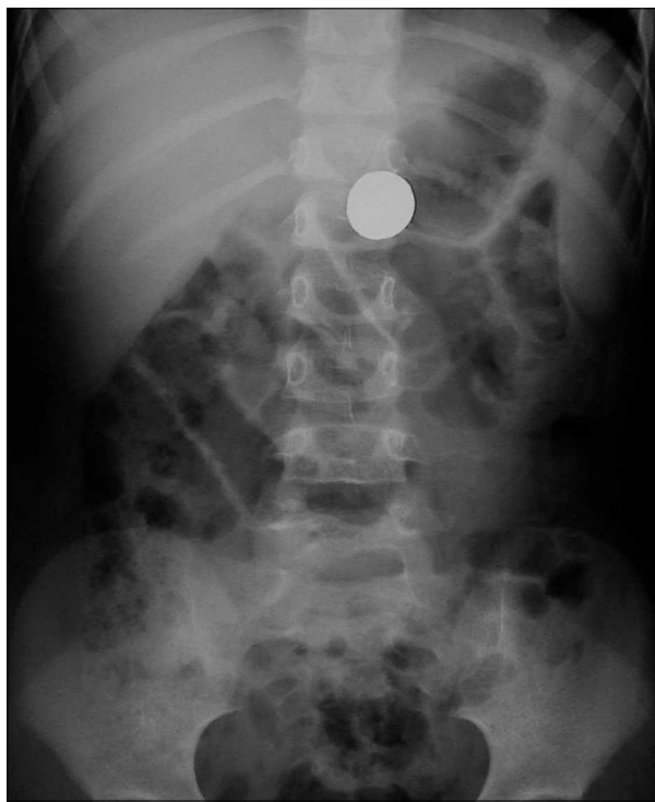
Figura 1. Radiografía simple anteroposterior de abdomen obtenida al ingreso, donde se observa una imagen radioopaca alojada en antro gástrico.

Llega a nuestro servicio de urgencias una niña de 3 años de edad, 3 h después de la ingestión accidental de un cuerpo extraño de plomo. Los padres refieren que el objeto es una pieza de plomo de uso habitual en pesca (plomada de pesca), de forma semiesférica y de aproximadamente 1 × 2 cm de tamaño. A la exploración física, la niña presenta buen estado general, sin sintomatología asociada, siendo sus constantes vitales normales. Se realiza radiografía de abdomen donde se visualiza cuerpo extraño de densidad metálica alojado en antro gástrico (fig. 1). Se obtiene acceso venoso periférico y se retira muestra sanguínea para hematimetría, bioquímica y determinación de valores de plomo en sangre. Inmediatamente se administra inhibidor de bomba de protones (omeprazol) y se traslada a quirófano de bomba de protones (omeprazol) y se traslada a quirófano para la retirada endoscópica del mismo. En quirófano y bajo anestesia general, se logra la retirada del cuerpo extraño, habiendo transcurrido 6 h desde la ingesta. El objeto extraído se corresponde con una plomada de pesca de forma semiesférica con 2 cm de diámetro y 0,5 cm de espesor máximo (fig. 2). La paciente ingresa en planta para vigilancia evolutiva y monitorización seriada de datos de toxicidad aguda y valores sanguíneos de plomo. Las muestras ana-