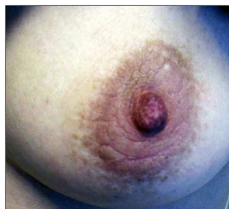
Figura 1. Placa hiperqueratósica, verrucosa y pigmentada localizada en el pezón y areola izquierda.

La hiperqueratosis nevoide del pezón y la areola es una entidad benigna que puede afectar al pezón, la areola o a ambas. Fue descrita inicialmente por Tauber 1 en 1923 (citado en Oberste-Lehn), pero Lévy-Franckel 2 estableció 15 años más tarde tres subtipos perfectamente diferenciados y caracterizados: a ) como forma de expresión de un nevo epidérmico; b ) asociado a ictiosis, y c ) la forma aislada e idiopática. En 1980 Mold y Jegasothy 3 añadieron un cuarto tipo, el relacionado con endocrinopatías, por lo que siempre es recomendable realizar un estudio hormonal si la clínica así lo indica. Aun así, Pérez Izquierdo 4 considera, desde un punto de vista práctico subdividirlos en los subtipos idiopático o nevoide y secundario.