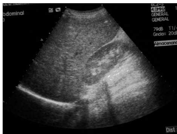
Figura 2. Hepatomegalia con ecogenicidad sugestiva de depósito de glucógeno correspondiente al caso n.º 3.

Clínicamente se detecta hepatomegalia y esplenomegalia de forma ocasional. Un hallazgo común en estos pacientes es el retraso de crecimiento y/o hipogonadismo secundario al aumento de cortisol. El resultado se detecta analíticamente como dislipemia, hiperglucemia y cetosis, y si las transgresiones continúan, elevación de las cifras de transaminasas por ocupación citoplasmática de glucógeno en los hepatocitos 8 . La magnitud de elevación de las transaminasas es variable y es poco frecuente la alteración de otros parámetros de función hepática como hipalbuminemia, coagulopatía, ascitis o hiperamonemia. La disminución de la hepatomegalia no se correlaciona con la normalización de las transaminasas ni de la glucemia 1 .