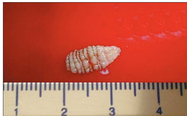
Figura 3. Larva de Dermatobia hominis .