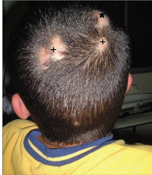
Figura 1. Lesiones noduloforunculosis causadas por miasis: *, lesión aguda; +, lesiones antiguas.

Otras especies como las del género Cuterebra no emplean vectores, sino que la mosca adulta pone los huevos