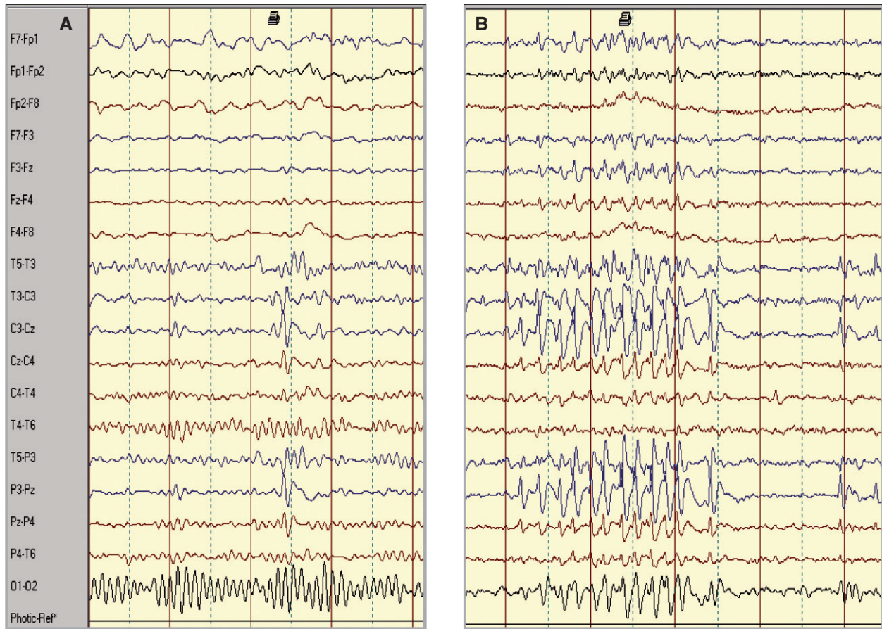
Figura 2. (A) Trazado electroencefalográfico en vigilia de un paciente en el que se registra actividad punta-onda de proyección media izquierda. (B) Durante el sueño aumenta la incidencia y duración de las descargas con difusión a áreas adyacentes.