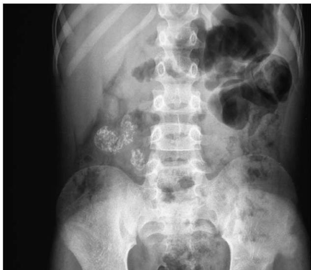
Figura 3 Rx de abdomen al finalizar el tratamiento. Adenopatías calcificadas.

Con la sospecha diagnóstica de tuberculosis abdominal se inició tratamiento con isoniacida, rifampicina, pirazinamida y etambutol, 2 meses, se suspendió la pirazinamida al conocer el resultado del cultivo y se continuó con isoniacida