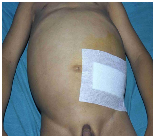
Figura 2 Tuberculosis abdominal. Distensión abdominal.