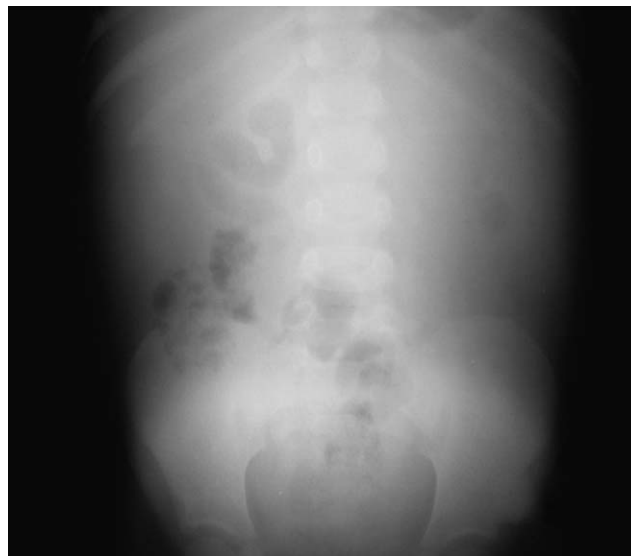
Figura 1 Rx de abdomen al ingreso: normal.

Varón de 4 años de origen marroquí, residente en España desde 15 días antes, que consultó por distensión abdominal de 2 meses de evolución sin otra sintomatología. Sin antecedentes de interés, no estaba vacunado de BCG y