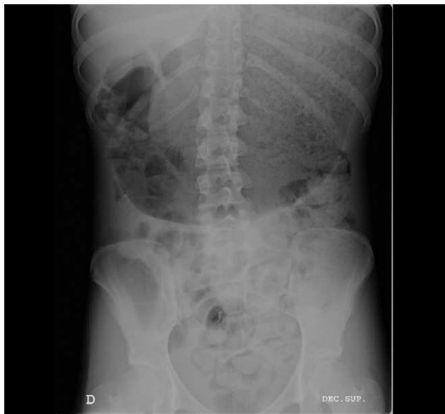
Figura 2 Imagen radiológica con gran distensión gástrica residual tras vaciamiento mediante sondaje nasogástrico.

atracción alimenticio con distensión abdominal y dolor) 1 por lo que su presencia debe provocar un alto índice de sospecha. Resulta esencial el reconocimiento precoz ante la elevada mortalidad descrita en caso de retrasarse el tratamiento (hasta un 80% 5 ) o aparecer complicaciones de gravedad como la rotura gástrica (ver más adelante).