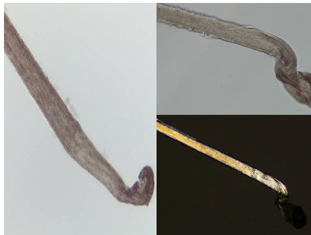
Figura 2 A, B) Tricograma: pelos terminales en fase anágena con morfología de bulbo en maza y cutícula de morfología espiroidee. C) La luz polarizada resalta la cutícula «en sacacorchos» sin observarse otras alteraciones.

El caso clínico se trata de una niña de dos años de edad que presentaba desde los pocos meses de edad, caída difusa del cabello, con pelo escaso y frágil, con abundante caída asociada al cepillado, sin otras lesiones cutáneas asociadas. La madre refería antecedentes personales de esta misma clínica a la misma edad, que se resolvió progresivamente. En la exploración física se aprecia una niña sana, de pelo castaño claro, escaso, frágil, de tacto áspero, con presencia de una alopecia difusa no cicatricial de todo el cabello y áreas más marcadas de alopecia centroparietal, en ausencia de pelos en signo de admiración ni áreas fibrosas ni otras alteraciones en el cuero cabelludo (fig. 1). Entre las exploraciones complementarias, el test de pilotración produjo la caída de 10 a 15 pelos terminales con mucha facilidad. El tricograma mostró la presencia de pelos