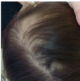
Figura 1 Fragilidad y escasez capilar en área centroparietal, sin otras alteraciones del cuero cabelludo.

capilar es indolora. El diagnóstico diferencial del SCAS se establece con las alopecias infantiles, entre otras: efluvio telógeno (afecta a ambos sexos, todas las edades y presenta un adelgazamiento capilar difuso), la tricotilomanía (ambos sexos, todas las edades y una morfología variable, con áreas de alopecia localizada con pelos cortos y de longitud irregular), la alopecia areata (afecta a ambos sexos, todas las edades, puede ser localizada o difusa, con placas alopécicas que albergan pelos en signo de admiración) y la alopecia androgenética 4,6 . Además, hay que tener en cuenta que en condiciones normales existe una pequeña cantidad de pelos en anágeno que caen y pueden quedar sueltos en el cabello: se desprenden a la pilotración de igual modo que en el SPAS pero en menor número, por lo que no constituyen una situación patológica.