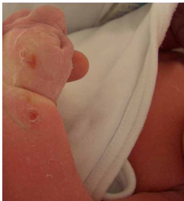
Figura 1 Erosiones superficiales de forma oval localizadas en muñeca y dorso de mano izquierda.

El diagnóstico de AS se establece ante un RN de buen estado general con lesiones cutáneas congénitas típicas en las localizaciones habituales, sin evidencia de ampollas en otras partes del cuerpo. Ayuda a confirmarlo ver al neonato succionando las áreas afectas. Incluso en ecografías fetales ya se puede detectar esta tendencia 2,3 . El diagnóstico diferencial incluye 1 : procesos infecciosos como infección por Listeria monocytogenes , enfermedades no infecciosas como