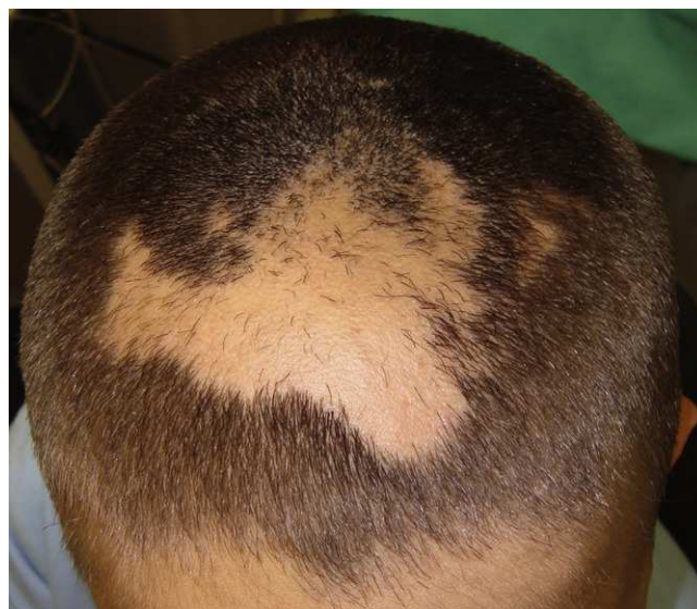
Figura 1 Área de alopecia con bordes irregulares y pelos sanos cortados a distintas longitudes en su interior (caso 1).

nóstico de alopecia por tricotilomanía e instauramos como tratamiento medidas orientadas al cambio conductual.