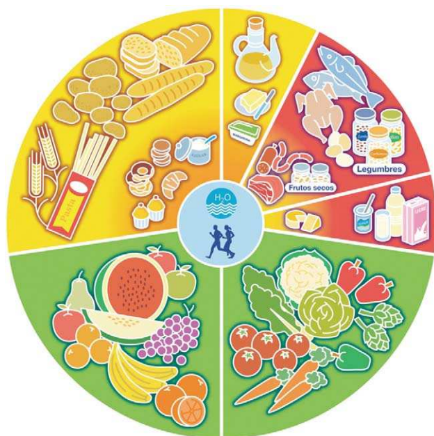
Figura 2 Rueda de los Alimentos.

no debe aportar más del 35% de la energía total diaria, incluyendo concentraciones bien controladas de AGS, AGP y AGM. Los AGS deben ser inferiores al 10% de las calorías diarias y el colesterol inferior a 300 mg, reduciendo al máximo la presencia de ácidos grasos trans . Actualmente, las margarinas comercializadas para consumo familiar son fuente de AGP, con escaso o nulo contenido en trans , como se comenta más adelante. Finalmente, para mejorar el perfil graso de nuestra dieta es preferible elegir pescado y carnes preferentemente magras y leches desnatadas.