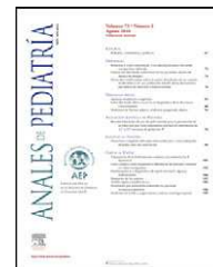
IMAGEN EN PEDIATRÍA