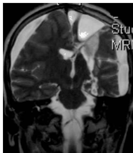
Figura 3 Imagen de RM (T2) corte coronal. RM de control tras hemisferectomía izquierda.

En cuanto a las medidas terapéuticas, inicialmente recibió tratamiento con carbamacepina, con empeoramiento del cuadro (aparición de mioclonías frecuentes en extremidades derechas). Se interrumpió el tratamiento y se instauraron clonazepam y clobazam, con mejoría a corto plazo. En los meses siguientes presentó aumento de mioclonías en los miembros derechos, pérdida de fuerza mantenida en los mismos y aparición de algún episodio de crisis parciales y alguna convulsión tónico-clónica generalizada. Ante el empeoramiento, se añadieron al tratamiento ácido valproico, corticoides y recibió 4 ciclos de inmunoglobulinas. No se volvieron a registrar convulsiones tónico-clónicas, pero se incrementó la frecuencia de crisis parciales y mioclonías. La degeneración motora y cognitiva también progresó, siendo incapaz de pronunciar muchas palabras, persistiendo paresia del miembro superior derecho y dificultades para la deambulación. Dado el fracaso del tratamiento médico, se decide remitir al mismo hospital de referencia para realización de tratamiento quirúrgico paliativo. A los 8 años y 8 meses de edad se le practica una hemisferectomía