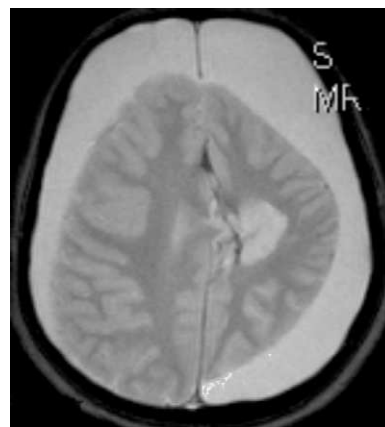
Figura 4 Imagen de RM (T2) corte axial. RM de control tras hemisferectomía izquierda.

El síndrome de Rasmussen es una enfermedad neurológica rara. Su edad de inicio es entre los 14 meses y los 14 años 3 , con una media alrededor de los 7 años de edad. La etiología se desconoce, aunque se han formulado varias hipótesis al