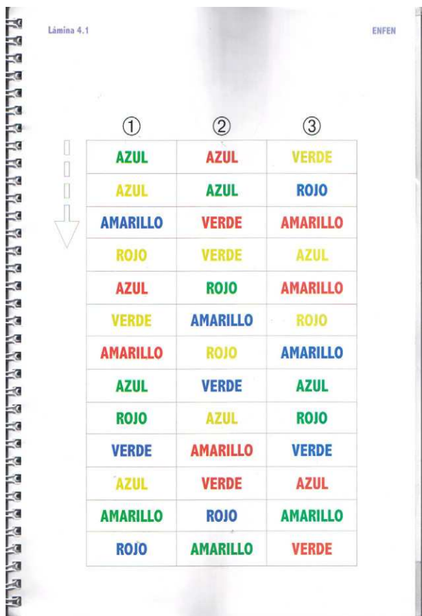
Figura 4 Interferencias.

En la tabla 1 se muestran las significaciones de las puntuaciones altas en cada escala (tabla 1).