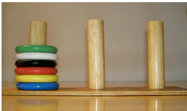
Figura 3 Anillas.

- Interferencias : inspirado en la tercera parte del test de palabras y colores ( Stroop ). Consta de 39 palabras dispuestas en 3 columnas verticales de 13 palabras cada una. Son nombres de colores (azul, verde, amarillo y rojo) impresos aleatoriamente en tinta de los mismos colores. En ningún caso coincide el color de la palabra con el de la tinta en que está impreso. La tarea a realizar es decir en voz alta y lo más rápidamente posible el color de la tinta de cada palabra (fig. 4).