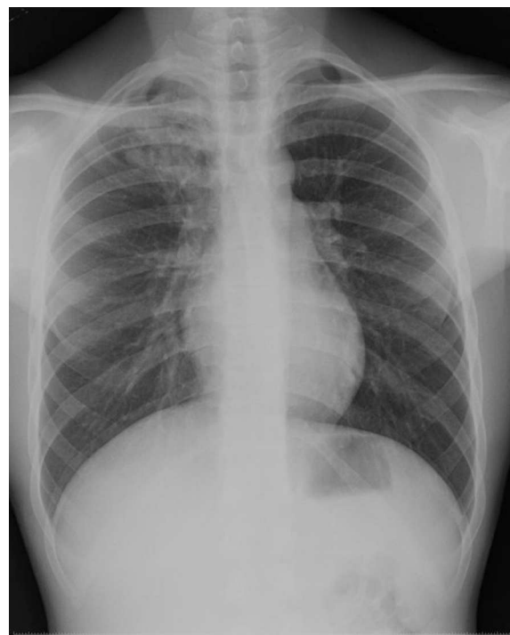
Figura 1 Radiografía de tórax que muestra infiltrado en el lóbulo superior derecho.

El escáner es la prueba de elección (localiza la lesión, determina su extensión y descarta otros diagnósticos) 1 . La broncoscopia suele ser normal, salvo que afecte a un bronquio principal 4 . Es más frecuente en lóbulo superior izquierdo (64%), seguido del lóbulo inferior izquierdo (14%), siendo rara la afectación pulmonar derecha (8%) 1,3 .