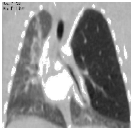
Figura 3 TC de tórax (reconstrucción coronal).

bronquial. Dada la estabilidad clínica respiratoria, se optó por un manejo conservador. Durante su seguimiento (actualmente tiene 10 meses), no se han producido incidencias, encontrándose asintomática.