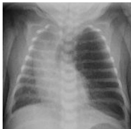
Figura 2 Radiografía tórax: hiperinsuflación del LSI con desviación mediastínica contralateral.

Recién nacido varón de 20 días de vida, sin antecedentes personales de interés, que acude a urgencias por cuadro de 24 h de evolución caracterizado por decaimiento, emesis, fiebre y analítica compatible con infección del tracto urinario. No refieren sintomatología respiratoria salvo respiración ruidosa. Se encuentra clínicamente estable, con tolerancia oral adecuada y sin compromiso respiratorio, apreciándose hipoventilación en campo superior izquierdo. En una radiografía de tórax se objetiva hiperinsuflación del hemitórax izquierdo con desplazamiento mediastínico contralateral