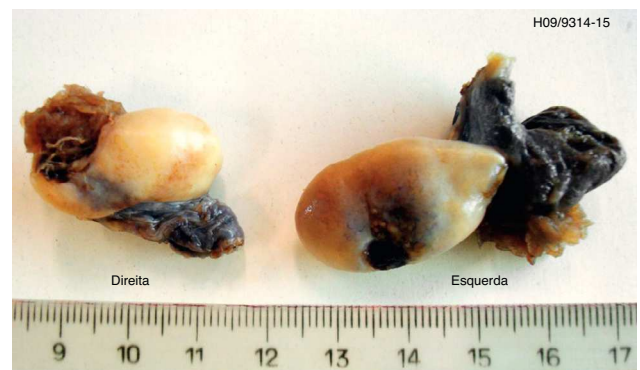
Figura 2 Macroscopia de la cirugía.

Otros posibles marcadores de células tumorales germinales, como la LDH y la \alpha -FP, tuvieron valores dentro de la normalidad. También Capito et al., en un estudio realizado con 11 casos de disgenesia gonadal pura 46 XY, describieron,