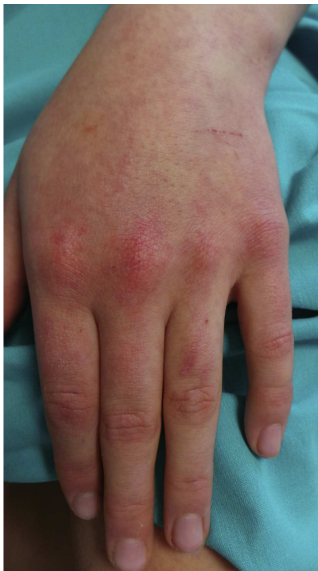
Figura 1 Lesiones maculopapulares eritematosas en el dorso, interfalángicas y metacarpofalángicas.

Exámenes complementarios: bioquímica plasmática: GOT 304 UI/l, GPT 188 UI/l, lactodeshidrogenasa 654 UI/l, creatinina: 6.469 U/l, aldolasa 30 UI/l, factor reumatoideo 10 UI/ml, IgA 150 mg/dl, IgM 306 mg/dl e IgG 931 mg/dl. Anticuerpos antinucleares (ANA/ENAS), negativos. ANA (IFI), negativo. Anticuerpos antitransglutaminasa tisular IgA 0,3 U/ml. Serología: borrelia, brucella, citomegalovirus, virus de Epstein-Barr, virus de la inmunodeficiencia humana, virus de las hepatitis B y C, parvovirus y toxoplasma, negativas. Resto de bioquímica y hemograma, dentro de la normalidad. Se practicó una resonancia nuclear magnética muscular (fig. 2), revelando edema a nivel de ambos deltoides, predominantemente en la porción posterolateral del músculo deltoides izquierdo y en el tríceps, rl bíceps braquial y el supraespinoso. Igualmente en ambos cuádriceps y glúteos medios. Electromiografía: disminución de la amplitud distal del componente motor de los nervios perineal y axilar. No actividad espontánea muscular en reposo. Disminución de la duración media de los potenciales de unidad