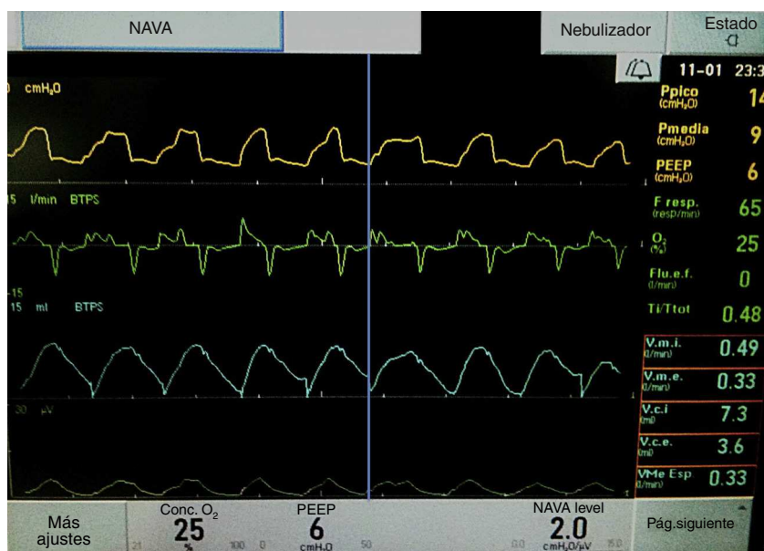
Figura 2 Paciente 1 tras el cambio a NAVA. Todos los esfuerzos de la paciente desencadenan la elevación de la presión en el ventilador con una intensidad y duración proporcional a los mismos. En el 3.º trazado puede apreciarse una mayor homogeneidad y constancia en el volumen corriente.

con \text{FiO}_2 0,3, presión positiva telespiratoria (PEEP) 5 \text{cmH}_2\text{O} y nivel de NAVA 3 para mantener un VT de 5 ml/kg, con picos de presión inspiratorios (PIP) similares a los previos (15 \text{cmH}_2\text{O} ). La sincronización paciente-ventilador mejora (fig. 2) y la niña se encuentra confortable, con picos Edi de 6-7 microvoltios y Edi Min de 2-3 microvoltios, que no se modifican sustancialmente durante el periodo de observación, manteniendo un VT de 5-6 ml/kg. Tras la estabilización inicial, se objetiva una reducción de los PIP en 1-2 \text{cmH}_2\text{O} , y de la frecuencia respiratoria, con VT estable. \text{SatO}_2 90-92%. Se disminuye la \text{FiO}_2 a 0,21 y se retira la sedoanalgesia. Progresivamente, se reduce el nivel de NAVA hasta 1,5 y 12 h después se extuba a VNI sincronizada neuralmente (NIV-NAVA), manteniendo buenas \text{SatO}_2 con \text{FiO}_2 0,21-0,3. Controles gasométricos normales. Desde los 60 días de vida permanece estable en ventilación espontánea.