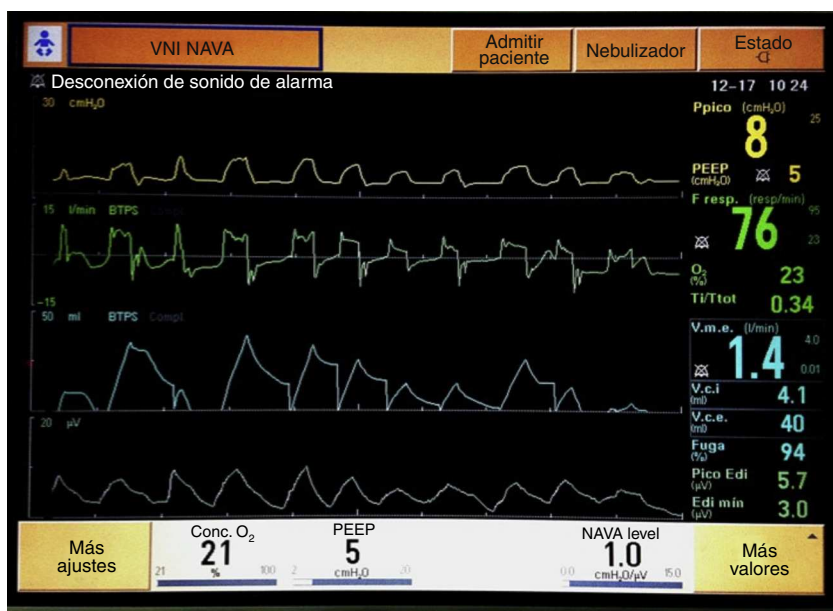
Figura 3 Paciente 2, en VNI-NAVA. A pesar del elevado nivel de fugas, los esfuerzos de la paciente son adecuadamente captados por la máquina, que genera presiones proporcionales a aquellos en frecuencia, intensidad y duración.

neurodesarrollo 16 . Por todo ello, el destete y la extubación han de llevarse a cabo tan pronto como sea posible. No obstante, el establecimiento de criterios fiables y seguros que eviten el fracaso de la misma está lejos de ser conseguido 17 .