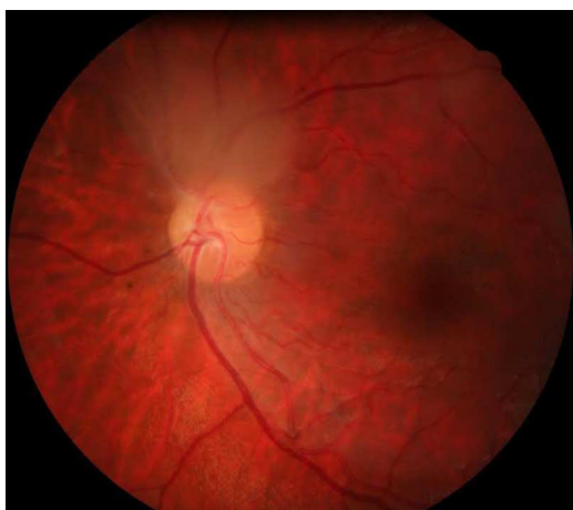
Figura 1 Funduscopya de polo posterior del ojo derecho, se observa masa translúcida blanquecina junto a nervio óptico en la salida de los vasos temporales superiores.

En la mayoría de casos será suficiente con revisiones oftalmológicas periódicas registrando imágenes para valorar el crecimiento. En caso de observar un comportamiento maligno se planteará la enucleación 2,3 .