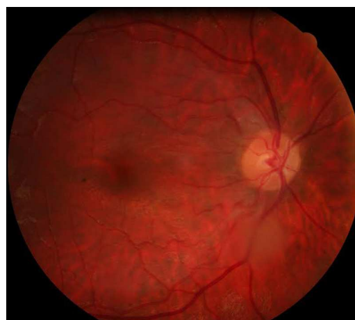
Figura 2 Funduscopya de polo posterior del ojo izquierdo, masa translúcida blanquecina en trayecto de arcada vascular temporal inferior.