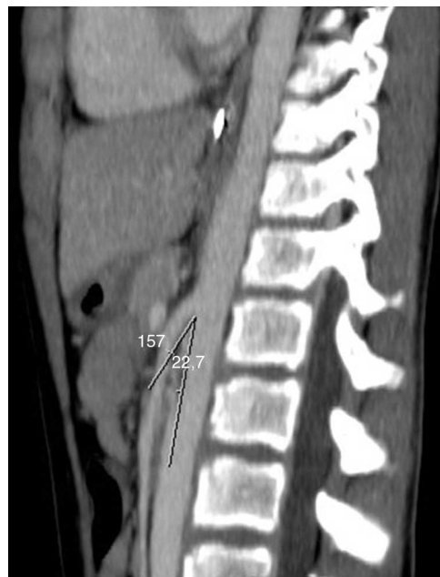
Figura 1 TAC: el ángulo aorto-mesentérico oscila entre 20 y 25° (criterio diagnóstico: menor de 25°).

El síndrome de Wilkie, o síndrome de la arteria mesentérica superior, tiene una incidencia del 0,013 al 0,3% de la población. Se debe sospechar ante un cuadro de dolor abdominal posprandial, asociado a náuseas y vómitos. Es un diagnóstico sobre todo de exclusión, con imágenes radiológicas características 1 . Es más frecuente en mujeres jóvenes y