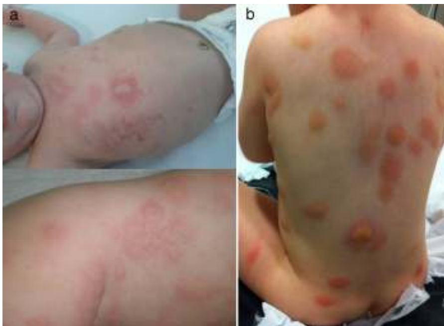
Figura 1 Casos 1 y 3. Múltiples lesiones eritematoedematosas y ampollosas algunas de ellas ligeramente amarillentas, de 1-2 cm distribuidas por toda la superficie corporal.

Recibe tratamiento con anti-H1 y anti-H2, ketotifeno, cromoglicato disódico oral, sesiones de psoralenos y luz ultravioleta (PUVA). Ha precisado 4 ingresos y 10 visitas a urgencias de pediatría (UP) por exacerbaciones.