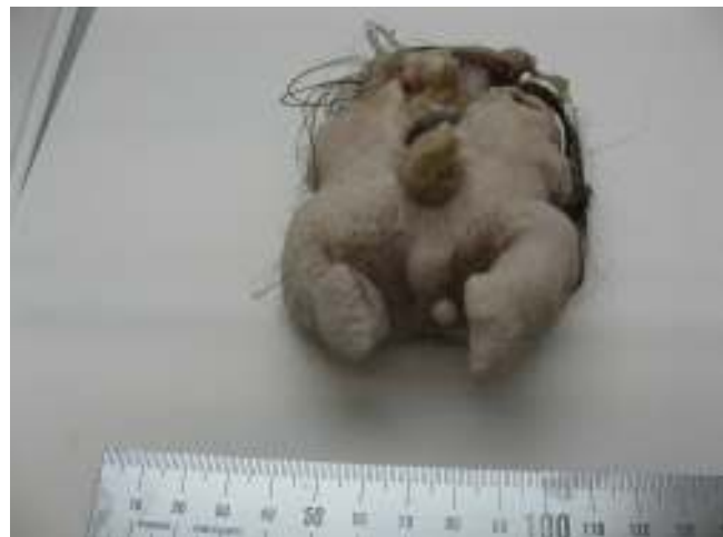
Figura 2 Pieza quirúrgica donde se reconoce el aspecto de feto rudimentario.