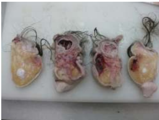
Figura 3 Diferentes cortes para examen anatomopatológico que muestran el esbozo intestinal y el tejido neural.

Tras una revisión de la literatura encontramos que el fetus in fetu y el teratoma fetiforme son 2 condiciones extremadamente raras, algunos autores describen diferencias morfológicas (presencia de columna, desarrollo