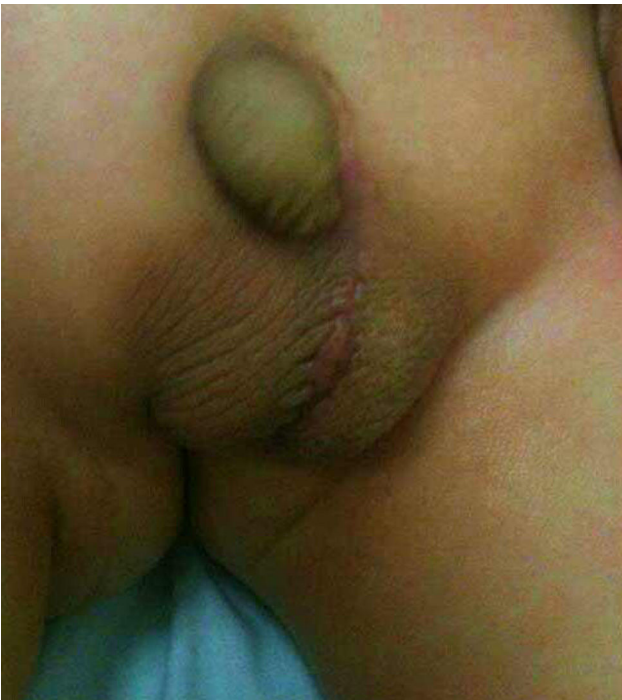
Figura 3 Resultado a los 6 meses de la intervención quirúrgica.