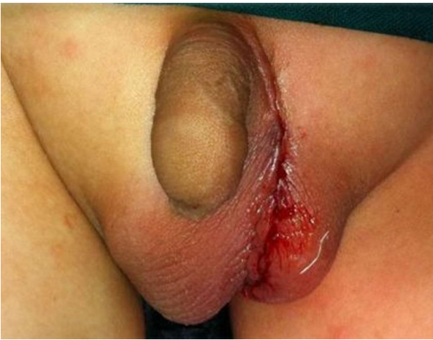
Figura 2 Resultado inmediato tras la intervención quirúrgica.