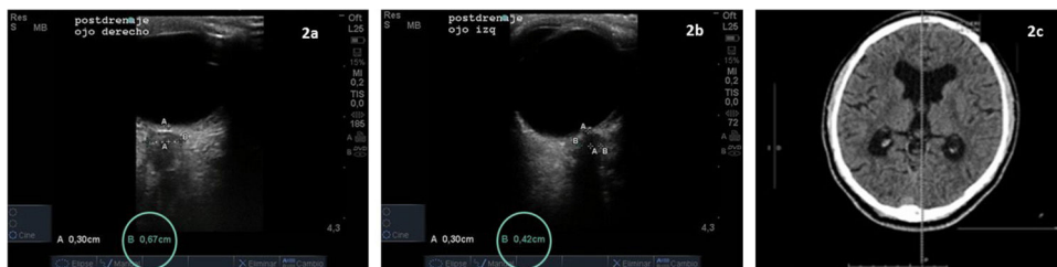
Figura 2 Ecografía de la VNO posdrenaje: diámetro lado derecho (a) 0,68-0,65 cm (disminución en relación con inicial) y lado izquierdo (b) 0,44-0,42 cm (normal). Resonancia magnética de control al mes (c): disminución del tamaño del sistema ventricular con disminución de la hiperintensidad circundante.