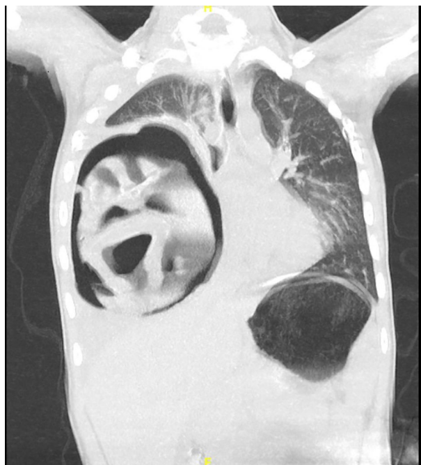
Figura 2 TC de tórax corte coronal. Gran lesión quística derecha con nivel hidroaéreo, atelectasia lobar media e inferior y desplazamiento mediastínico contralateral.