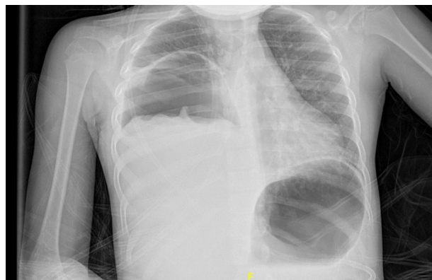
Figura 1 Radiografía de tórax PA. Gran lesión quística derecha con nivel hidroaéreo. La membrana del quiste hidatídico roto flotando en el nivel hidroaéreo origina el signo del nenúfar .

La hidatidosis es una zoonosis producida por Echinococcus granulosus . Tiene una distribución mundial y España es un