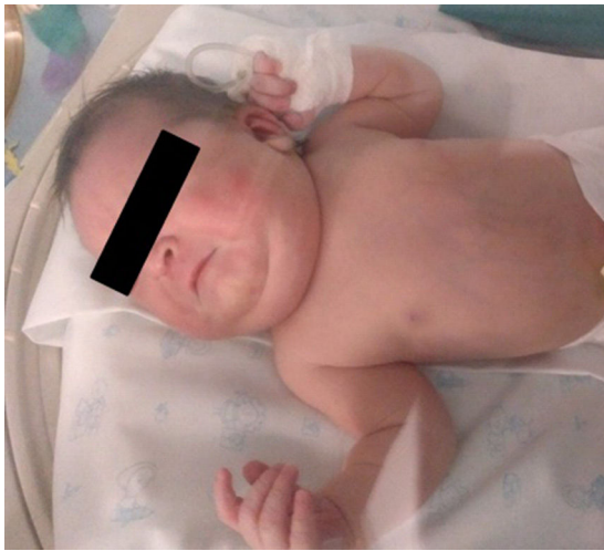
Figura 1 Fotografía. Aumento de la parte anterior del cuello y de la zona supraclavicular, dependiente de partes blandas.