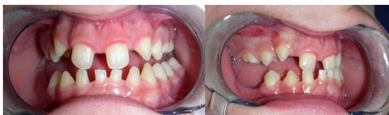
Figura 1 Imagen intraoral en proyección frontal (A) y lateral (B) evidenciando ausencia de múltiples dientes definitivos y presencia de dientes deciduos a los 12 años. Diastemas severos sugestivos de agenesia dental congénita.

La ADC es la ausencia de uno o más dientes. Su incidencia varía entre el 3 al 10% de la población, siendo su presentación más común la ausencia del tercer molar 1 . Su clasificación se realiza en función de los dientes ausentes: anodoncia (ausencia total de dientes), hipodontia (ausencia inferior a 6 dientes) y oligodoncia (ausencia superior a 6 dientes), como sería el caso de nuestro paciente 1 .