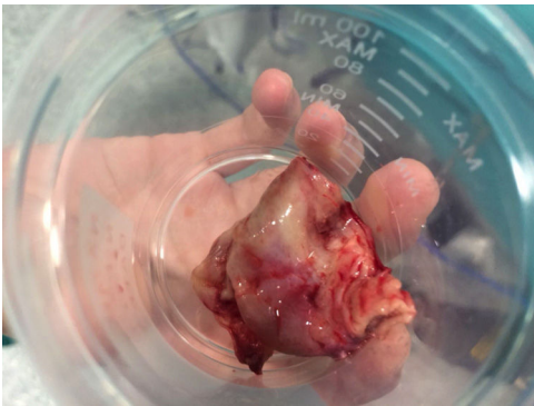
Figura 3 Aspecto macroscópico de la lesión resecada.

o cardiomegalia inexplicada. La ecocardiografía es una técnica accesible, barata y bien tolerada, útil en estos casos excepcionales 3 .