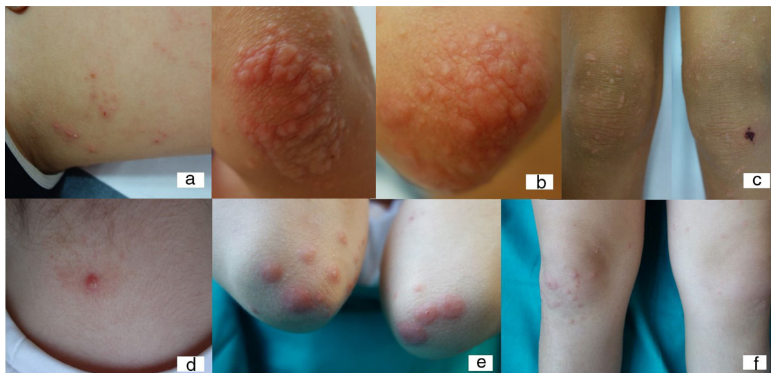
Figura 1 Paciente 3: niño de 10 años con reacción al síndrome de Gianotti-Crosti-like a Molluscum contagiosum ; 1 a) Lesiones inflamadas de molusco contagioso en el muslo; 1 b) Pápulas edematosas inflamatorias rojizas en los codos; 1 c) Pápulas rosáceas en las rodillas, fenómeno de Koebner secundario al rascado. Paciente 1: niña de 8 años con reacción al síndrome de Gianotti-Crosti-like a Molluscum contagiosum ; 2 a) Molusco contagioso inflamado en la región cervical; 2 b y c) Pápulas edematosas rojizo-rosáceas en codos y rodillas.

Las RSGC-L se caracterizan por pápulas liquenoides alrededor de los codos, las rodillas y las nalgas. La aparición de estas reacciones no está relacionada con el número de lesiones de MC 5 . Esta reacción puede estar presente en la visita inicial (50%) o desarrollarse uno o 2 meses después de iniciarse el tratamiento de MC (38%), independientemente del tratamiento recibido 5 . En niños, las RSGC suelen asociarse a infecciones virales (virus de Epstein-Barr o hepatitis), en las que el desarrollo de lesiones cutáneas asintomáticas suele ir precedido de febrícula, dolor de garganta o malestar general. Estos pacientes sufren una respuesta inflamatoria seria y muy pruriginosa al MC, con desarrollo de estas lesiones típicas y en la mayoría de los casos con resolución espontánea del MC en pocos días o semanas.