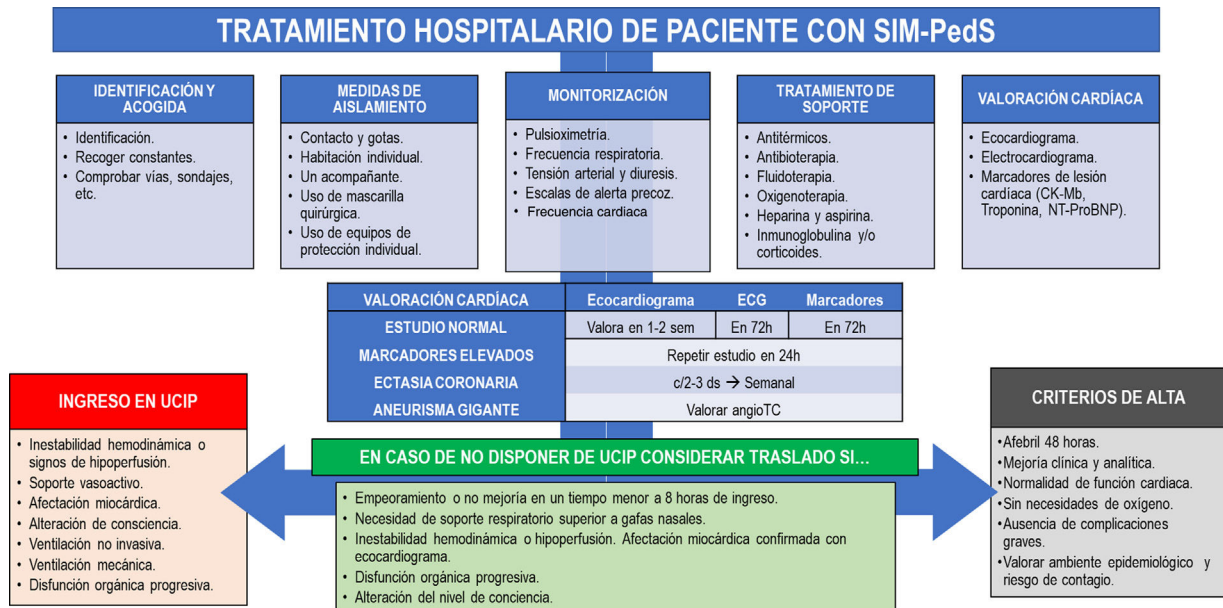
Figura 2 Tratamiento y seguimiento hospitalario del paciente con SIM-PedS.

a Valores orientativos, considerar los de referencia para cada centro hospitalario.