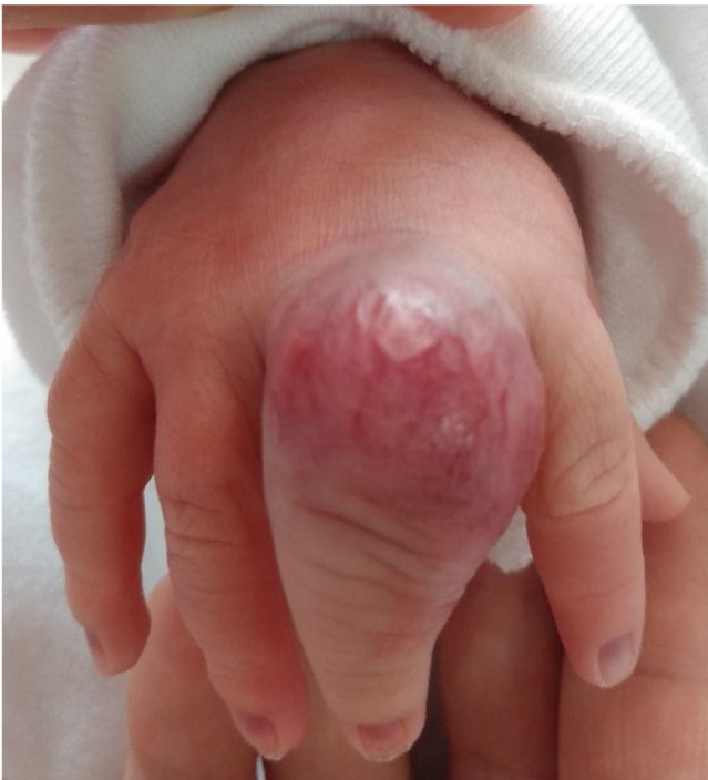
Figura 1 Hemangioma congénito al nacimiento.