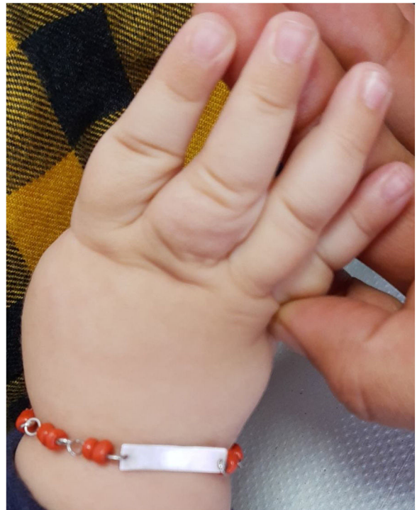
Figura 3 Involución de hemangioma congénito a los 9 meses.