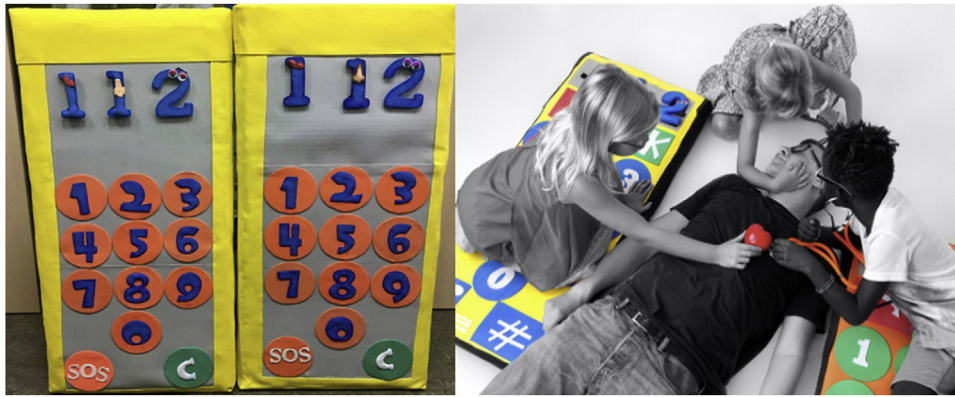
Figura 1 Teléfonos móviles gigantes empleados en la simulación (izquierda) y juegos de rol (derecha) en el método formativo RCPParvulari®.

sugieren que los escolares de cinco a ocho años retienen bien lo aprendido, y los resultados de sus evaluaciones no son inferiores a los de niños mayores o adultos 1,8 . Incluso hay estudios que han demostrado que los niños de cinco a ocho años son capaces de comprender la cadena de supervivencia y cómo activarla 1,11-13 , aunque no se ha evaluado el impacto de la formación en SVB a estas edades. De hecho, actualmente no hay ningún cuestionario validado para evaluar los conocimientos de SVB en niños pequeños.