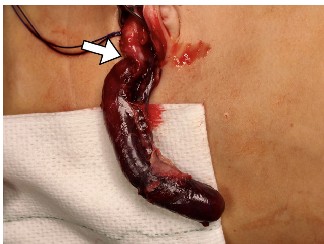
Figura 2 Durante el abordaje transumbilical video-asistido se apreció escasa cantidad de líquido seroso y un plastrón inflamatorio no purulento adherido a la pared abdominal anterior, conteniendo el apéndice cecal. Al exteriorizar el órgano se evidenció una torsión apendicular de 360° en sentido horario a 3 cm de la base, que condicionaba una zona de cambio de calibre y coloración (flecha). Distal a este punto, el apéndice tenía un aspecto gangrenoso-violáceo, tenso y con intensa ingurgitación venosa, aunque sin reacción purulenta ni perforación macroscópica. Sin embargo, en el área proximal al punto de torsión, tanto el apéndice como su mesenterio presentaban un aspecto normal. La histopatología informó de apendicitis gangrenosa y áreas hemorrágicas.

14 h después identificando menos leucocitosis (19.100), descenso de PCT (0,3), aunque ligera elevación de PCR (69). Una nueva ecografía mostró un apéndice de hasta 11 mm (fig. 1) y la cirugía reveló un plastrón no purulento conteniendo un apéndice torsionado que fue resecao. Los hallazgos operatorios se muestran en la figura 2 y se ilustran en la figura 3. La evolución postoperatoria fue favorable, dándose el alta 5 días después.