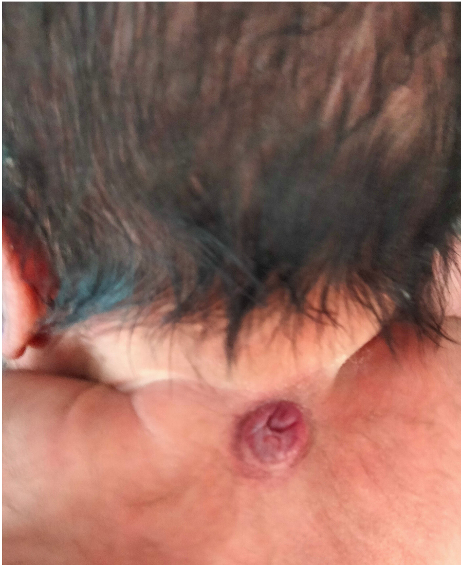
Figura 2 Exploración a las 24 horas: lesión con contenido fluctuante serohemático.