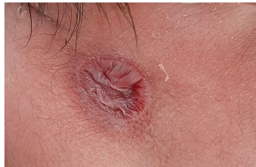
Figura 1 Exploración al nacimiento: membrana flácida, sin contenido aparente ni signos inflamatorios.

Al día siguiente se objetiva engrosamiento de la lesión con contenido serohemático que aumenta de tamaño con el aumento de la presión intraabdominal (fig. 2). Se realiza una ecografía cervical, que muestra un trayecto hipocogénico que alcanza un área de pequeña ausencia de fusión de láminas posteriores. Se realiza una resonancia magnética, en la cual se visualiza un trayecto ascendente que alcanza el saco tecal, ligeramente dilatado a nivel de C4-C5, con médula levemente traccionada hacia el mismo con inclusión de las